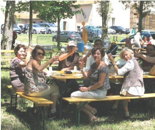
Pique-nique à la Cave Monge Granon - Drôme